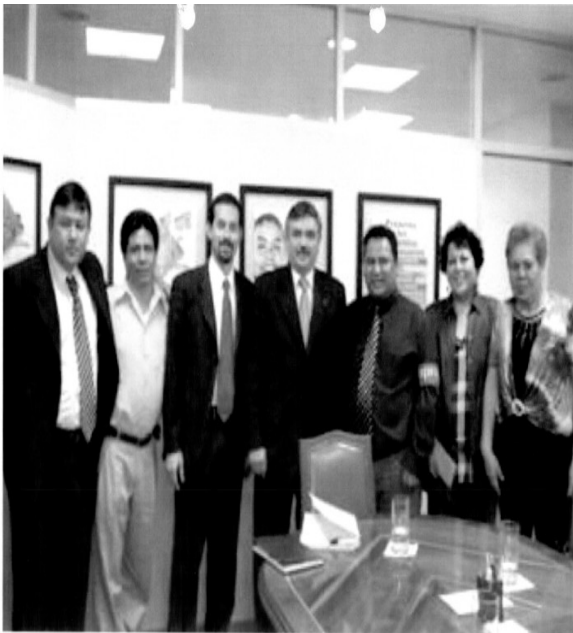
Reunión de presidentes de APN's con el presidente del IFE, Leonardo Valdés Zurita, el 21 de enero de 2010.