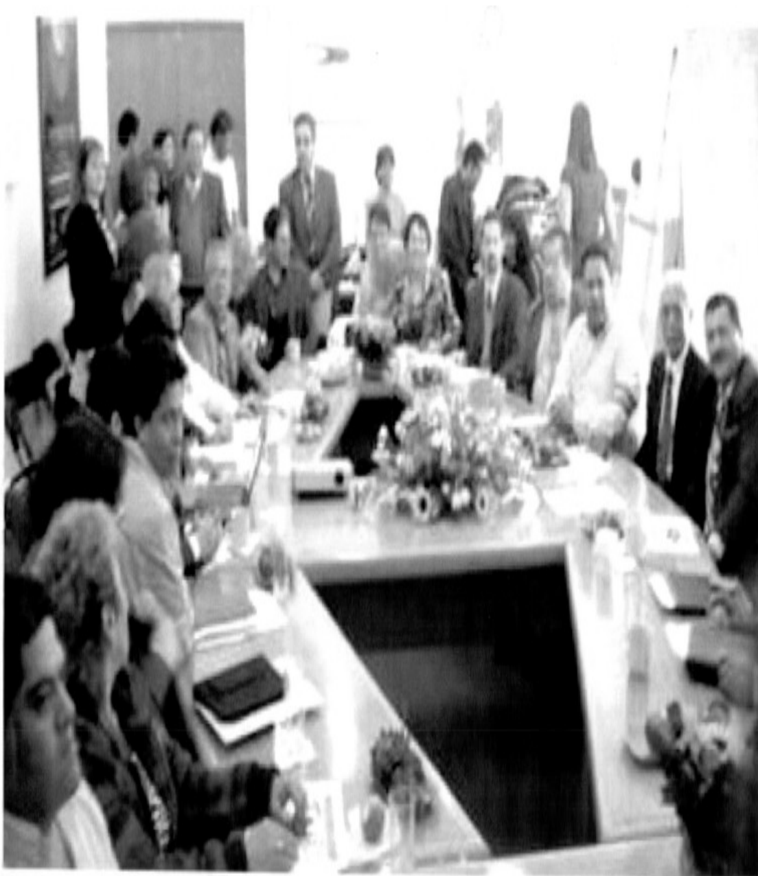
Reunión de Agrupaciones Políticas Nacionales y Locales con la Directora de Enlace Civil del Gobierno del D.F., el 25 de enero de 2010.