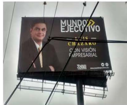
Testigo del monitoreo