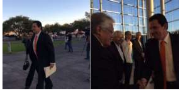
Candidato Movimiento Ciudadano/Leoncio Morán