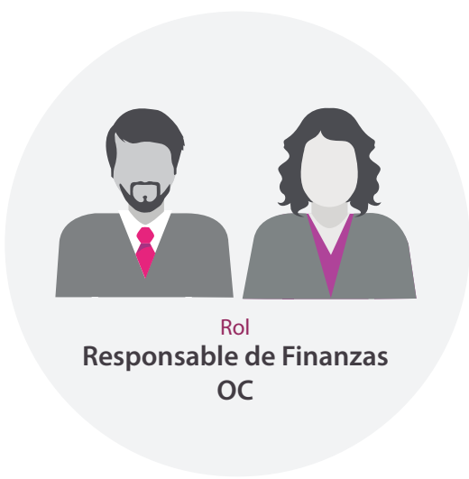
Rol Responsable de Finanzas OC