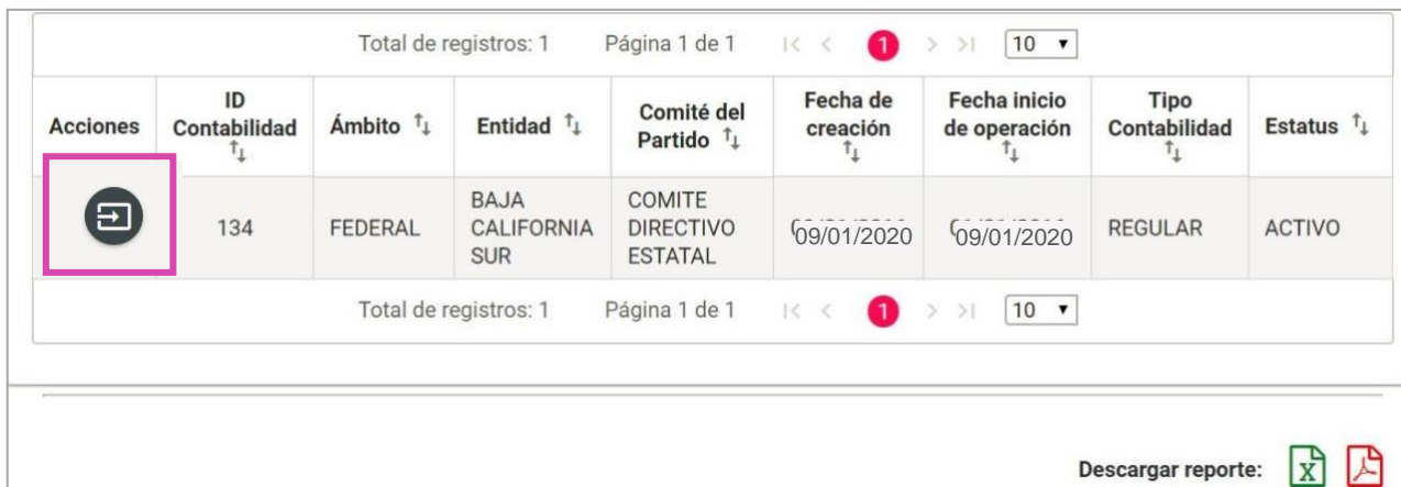
Figura 3.1 Selección de Contabilidad