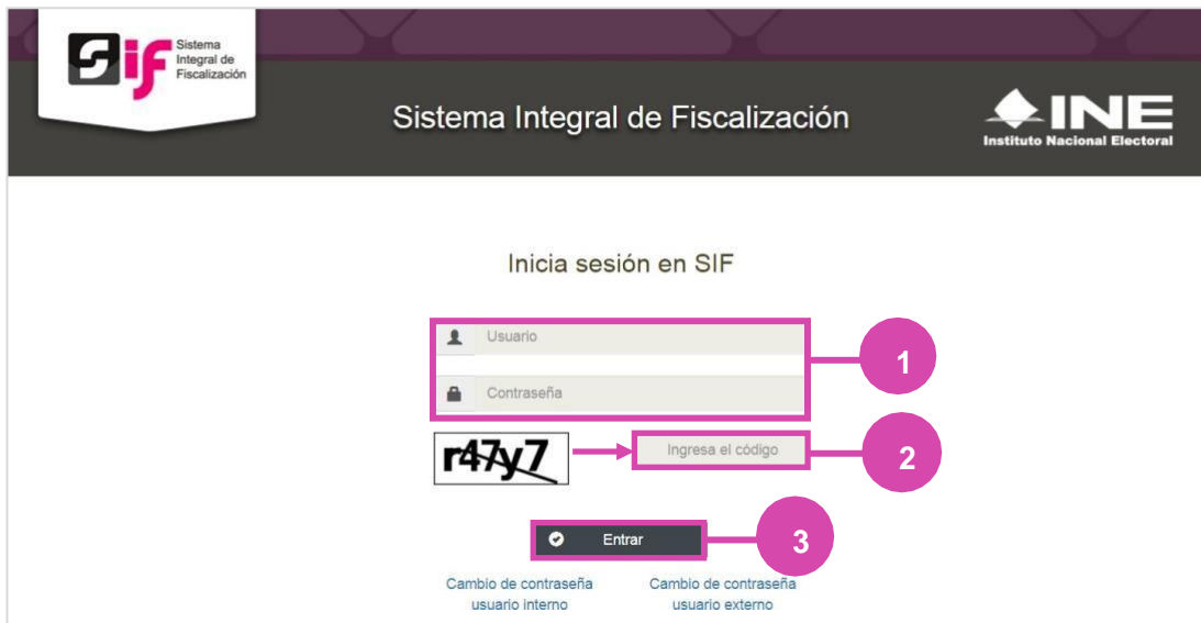
Figura 1.0 Inicio