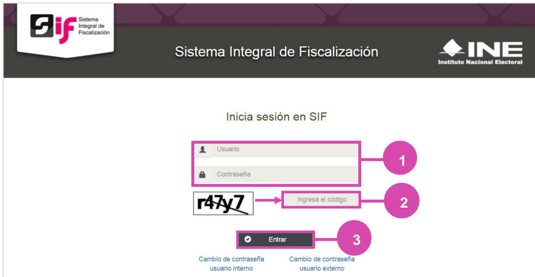
Figura 1.0 Inicio