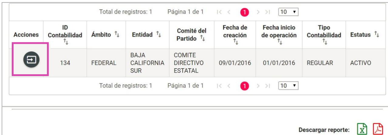
Figura 3.1 Selección de Contabilidad