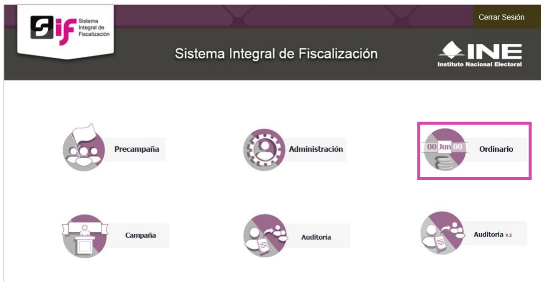
Figura 2.0 Selección de Proceso