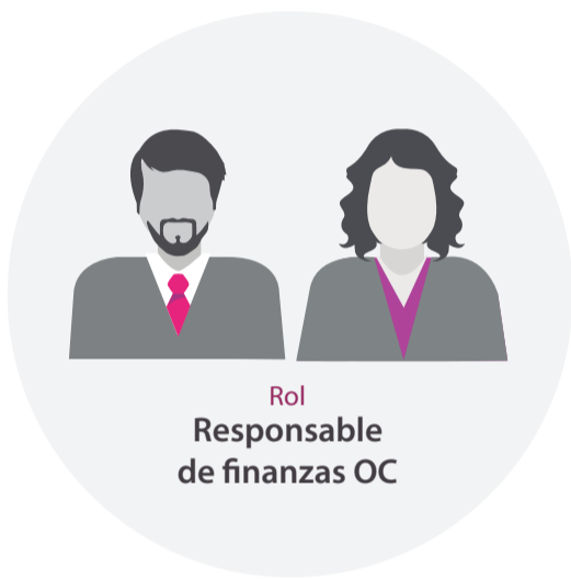
Rol Responsable de finanzas OC