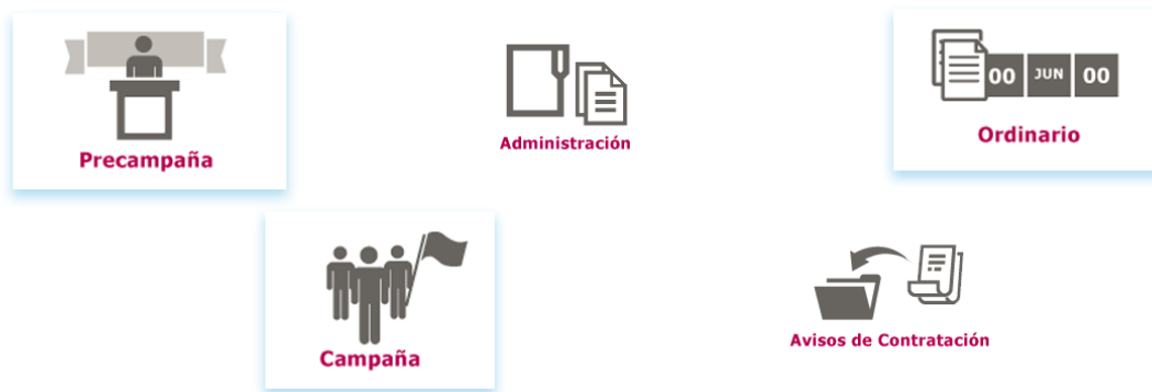
Figura 1.0 Menú de sistemas

Ingresar a uno de los procesos: Precampaña, Campaña u Ordinario.