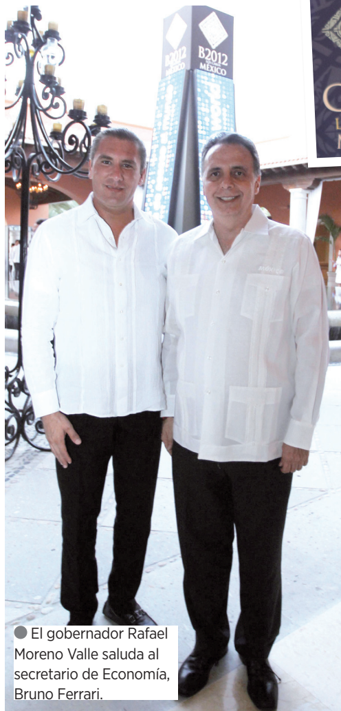
● El gobernador Rafael Moreno Valle saluda al secretario de Economía, Bruno Ferrari.