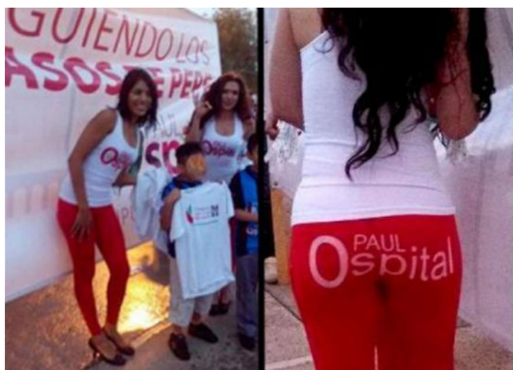
Figura 10. Publicidad de Paul Ospital Carrera, del PRI de Querétaro