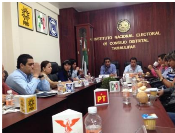
Figura 2. Sesión del 05 Consejo Distrital, en la que se redujo el número casillas. 6 abril 2015