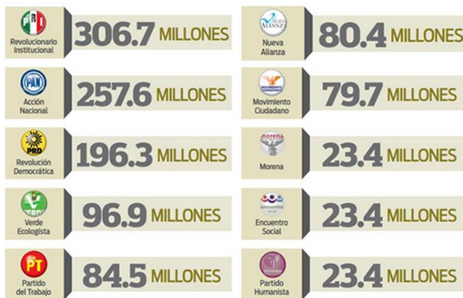
Figura 5. Montos de campaña asignados por el INE a cada partido

En las campañas políticas los diez partidos registrados criticaron a los contrarios, difundieron logros de gobiernos e hicieron promesas. Mediante concentraciones, carteles, bardas pintadas y spots de radio y televisión entraron en una lucha para mover a los ciudadanos a que votaran por sus candidatos.