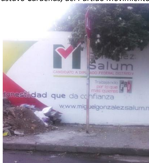
Figura 16. Publicidad de Miguel González Salum del PRI de Tamaulipas