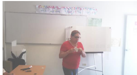
Figura 21. Electora votando