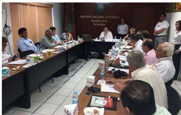
Figura 4. Sesión del Consejo Local en la que inicia el recuento del 60% de las casillas en Tamaulipas. 10 de junio de 2015

No pude observar directamente cómo se llevaron a cabo las sesiones de los demás consejos distritales de Tamaulipas, ni de los consejos locales y distritales de otras entidades federativas 2 . No pude saber si hubo orden y respeto en las sesiones.