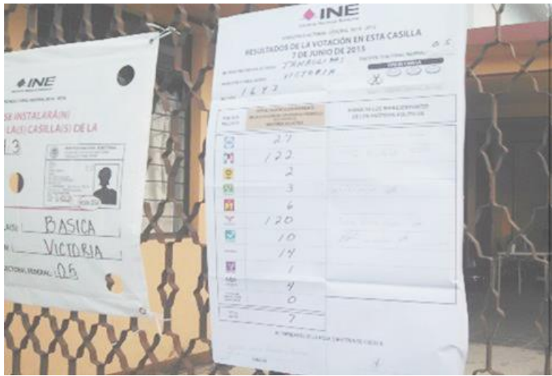
Figura 22. Publicación de resultados de votación