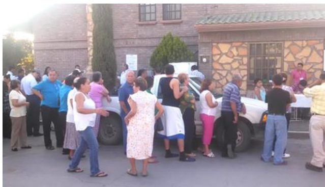
Figura 17. Electores haciendo fila para votar

A continuación muestro algunas de las fotografías que tomé.