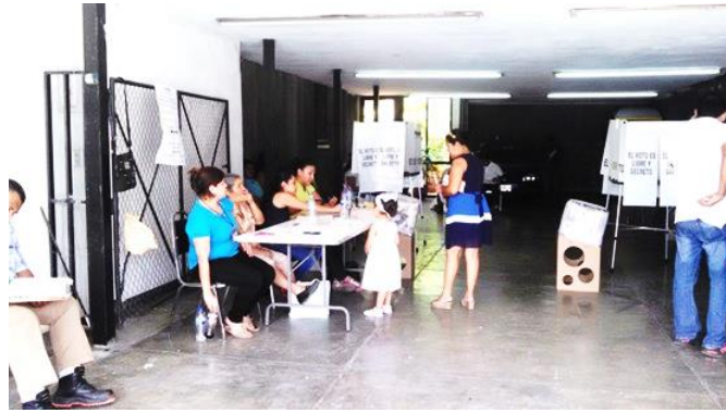
Figura 18. Electora votando