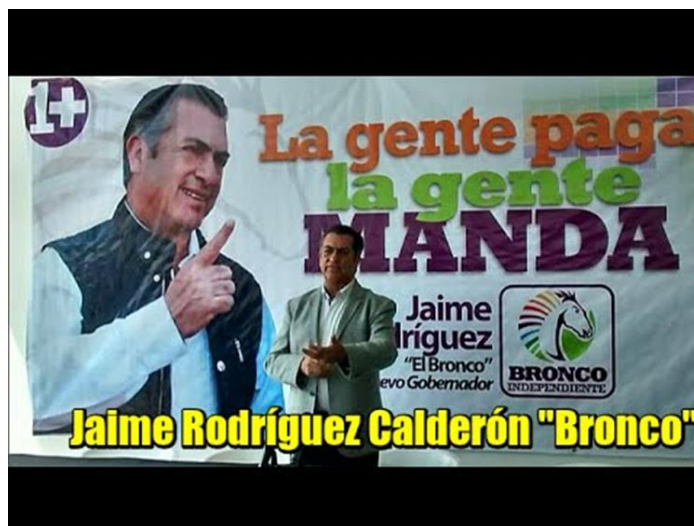
Figura 12. Publicidad de Jaime Rodríguez, Candidato Independiente, de Nuevo León

Los 22 candidatos independientes recibieron $ 23'457,274.82 como financiamiento para sus campañas, es decir, poco más de un millón de pesos para cada uno. La publicidad que hicieron fue en menor escala, pero igual de simple.