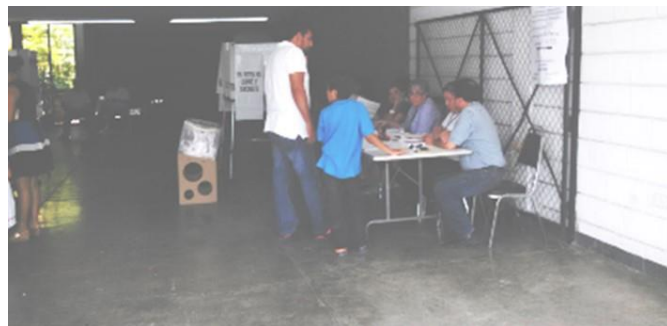
Figura 20. Elector votando