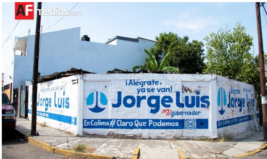
Figura 6. Barda con publicidad de Jorge Luis Preciado, del PAN de Colima

Considero que las campañas no ayudaron mucho a que el ciudadano obtuviera un punto de vista claro sobre cada candidato. Su publicidad fue de tipo comercial, como para convencer de que se comprara algo, sin entrar en aspectos serios que mostraran la realidad de cada candidato. Como es costumbre, los partidos políticos usaron bardas y anuncios panorámicos para dar publicidad a sus candidatos, dándonos como información para votar sólo un nombre, una foto, una frase o una sonrisa.