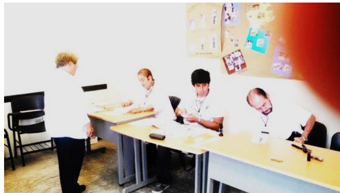
Figura 19. Electora votando