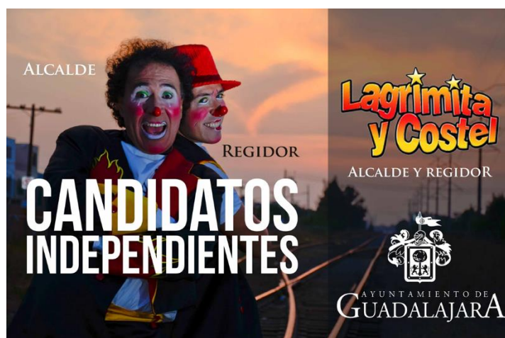
Figura 13. Publicidad de Guillermo y Costel Cienfuegos, candidatos independientes de Jalisco