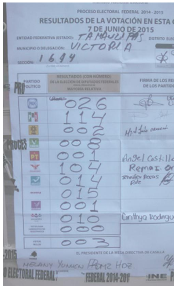
Figura 23. Resultados de votación