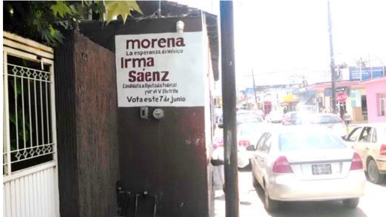
Figura 14. Publicidad de Irma Sáenz del Partido Morena de Tamaulipas

Las campañas en Tamaulipas fueron similares pero menos intensas. Los partidos se dedicaron a ganar votos mediante concentraciones, carteles, bardas pintadas y spots.