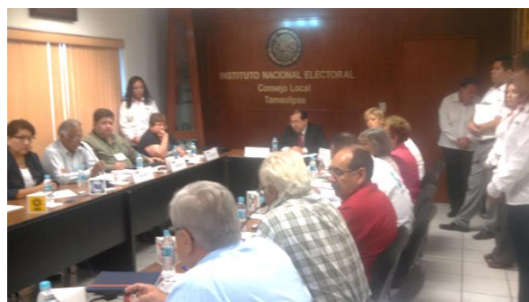
Figura 3. Sesión del Consejo Local Tamaulipas