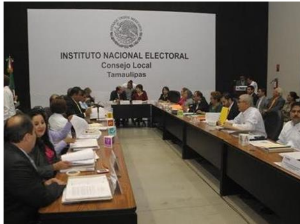
Figura 1. Se instala Consejo Local del INE en Tamaulipas. 6 de noviembre de 2014.

En las sesiones que asistí observé que éstas se desarrollaron con orden y respeto. Personalmente constaté que los comentarios de los consejeros electorales, representantes de partidos políticos, así como los vocales fueron siempre respetuosos, y aunque a veces atacaban o defendían con firmeza acciones y puntos de vista, todas las discusiones y diálogos que vi y oí se llevaron con orden y respeto, sólo buscando el avance justo de la preparación y desarrollo del proceso electoral.