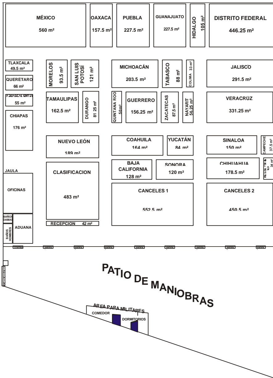
CROQUIS CON LA DISTRIBUCION DE AREAS DE LA BODEGA CENTRAL DEL INSTITUTO

LA BODEGA QUEDO DIVIDIDA DE LA FORMA SIGUIENTE: