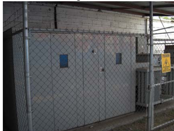
Buenas Condiciones Físicas (Planta de Luz)

La bodega central de organización electoral ya está en operación y en espera de una visita de los integrantes de la Comisión de Capacitación y Organización Electoral.