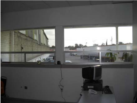
Instalaciones Suficientes para Oficinas