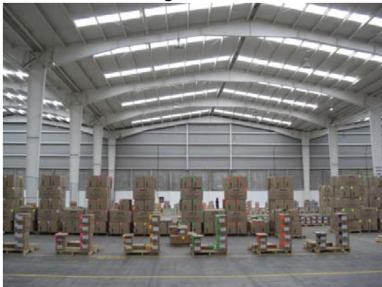
Buenas Condiciones Físicas