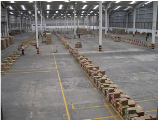
Superficie Necesaria para Almacenamiento