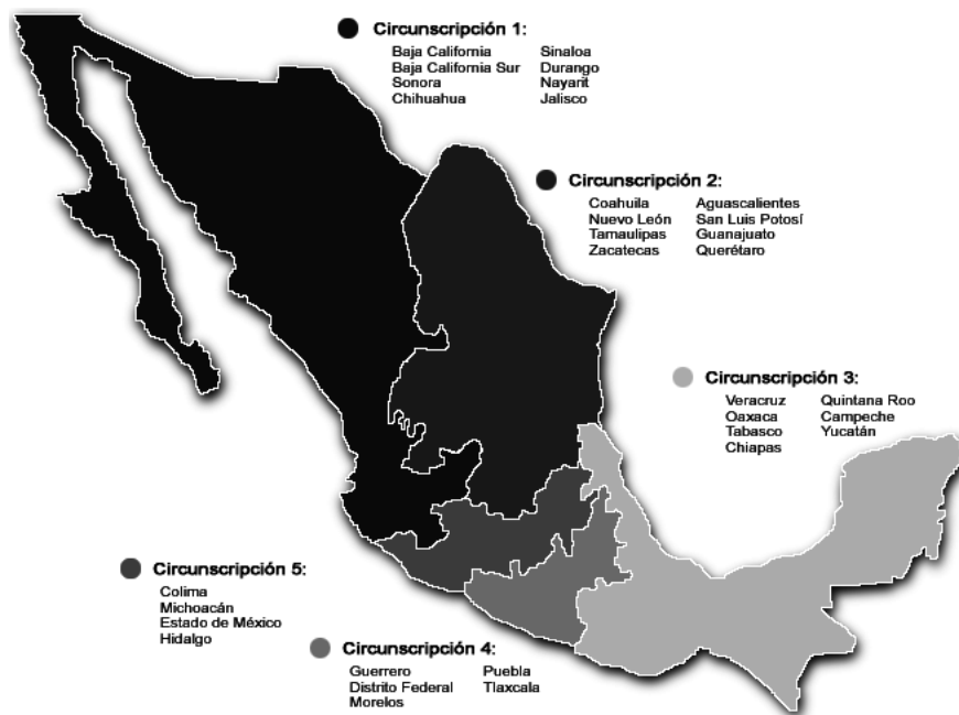
Figura 1: Estratos regionales (Circunscripciones plurinominales).

Número de conglomerados seleccionados. Se seleccionaron 100 conglomerados, distribuidos de manera proporcional al tamaño de su estrato. La distribución geográfica de la muestra se presenta en la Figura 2. La imagen del lado derecho indica las secciones del D.F. y Estado de México mientras que la imagen del lado izquierdo indica las secciones del resto del país. Los centroides de las secciones fueron obtenidas con la cartografía digital del INE.