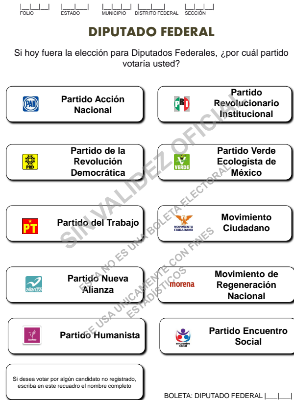
Figura 4: Boleta simulada