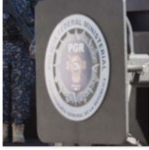
Batimóvil , la nueva arma de la PGR contra la delincuencia