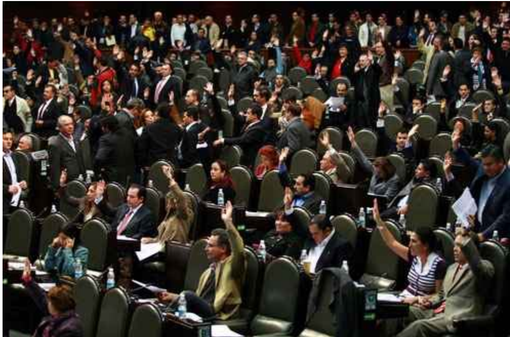
Votación en San Lázaro

MAYO 16, 2014 Omar Granados (@ogranados1)