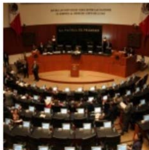
Ley leyes electorales, a detalle