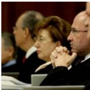
Magistrados del Trife dicen que no recibirán pensión vitalicia, sólo “un haber de retiro”