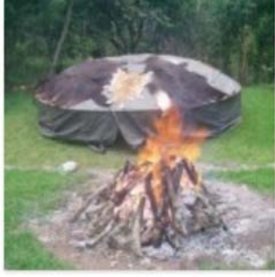
Campamentos y cabañas: 6 opciones para consentir tu bolsillo