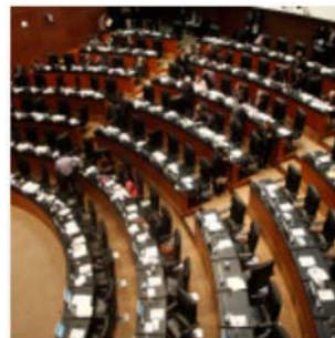
Posponen reforma política-electoral para extraordinario