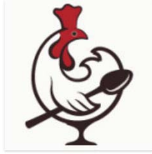
Visita Animal Gourmet